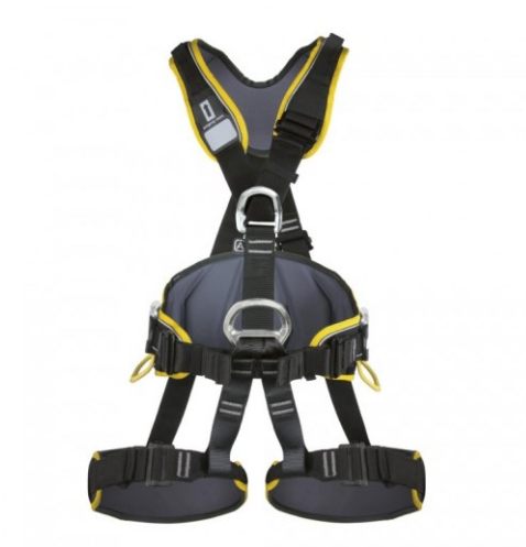
obrázek č. 8