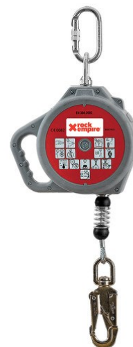
obrázek č. 9