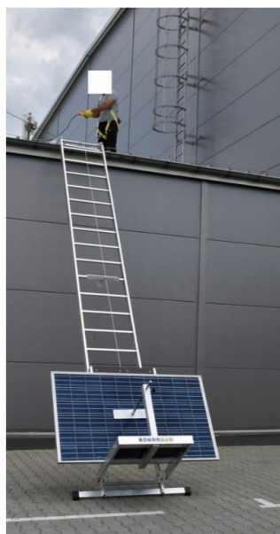
obrázek č. 7

Doprava materiálu bude zajištěna přes žebříkový střešní výtah s vozíkem na fotovoltaické panely obrázek č.7. Pokud si zhotovitel zvolí jiný způsob dopravy panelů a stavebního materiálu, musí tento způsob a postup projednat s koordinátorem BOZP.