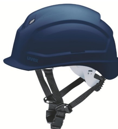
obrázek č. 10